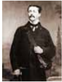
Josef Viktor von Scheffel

Josef Viktor von Scheffel (1826–1886), einem der populärsten deutschen Dichter des 19. Jahrhunderts, haben wir den wohl nachhaltigsten Beitrag zur Wildkirchli- und Alpsteinbegeisterung zu verdanken. Im Jahre 1854 weilte er eine Woche lang im Wildkirchli und im Gasthaus Äscher. Die Einsiedelei spielt in seinem Roman «Ekkehard» eine zentrale Rolle: Hierher zog sich der temperamentvolle junge Mönch Ekkehard nach einer Liebestragödie zurück. Das Leben in der «gewaltigen Natur» und bei den einfachen Sennen hat Ekkehard geholfen, den Weg als Dichter und zu sich selbst zu finden. Der Roman «Ekkehard» ist in weit über 200 Auflagen erschienen und hat dem Wildkirchli auch literarischen Weltruhm verschafft. Scheffel zu Ehren wurde 1902 ein Denkmal an die Äscherwand angebracht.