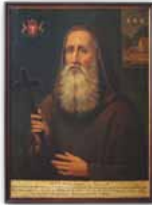
Pater Philipp Tanner, Gründer der Kapelle im Wildkirchli. Idealportrait, um 1820

Seit der Gründung der Einsiedelei bis zum Jahr 1853 lebten rund zwei Dutzend Männer aus dem Laienstand als Einsiedler im Wildkirchli und sorgten für das Heiligtum. Die Eremiten läuteten fünfmal täglich zu den Betzeiten die Glocke. Sie durften zwei Ziegen halten und bekamen von den Sennen Butter, Käse und Molke. Als im Jahre 1853 der Eremit Anton Fässler beim Laubsammeln tödlich verunglückte, wurde die Einsiedelei nicht mehr besetzt. Anstelle des baufälligen Eremitenhäuschens entstand das Gasthaus «Wildkirchli». Das heutige kleine Museum trat schliesslich als Rekonstruktion des früheren Eremitenhäuschens 1972 an die Stelle des Gasthauses.